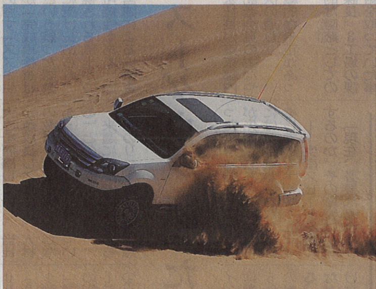
改造した四輪駆動車によるクブチ砂漠の走行が人気を集めている