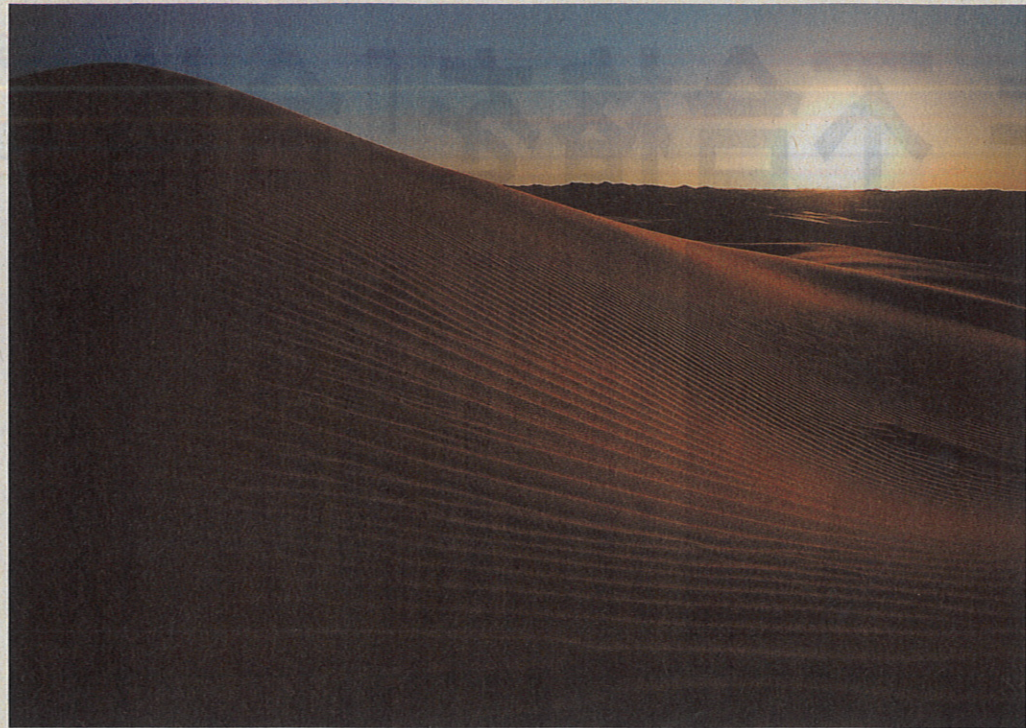
夕日に照らされるクブチ砂漠