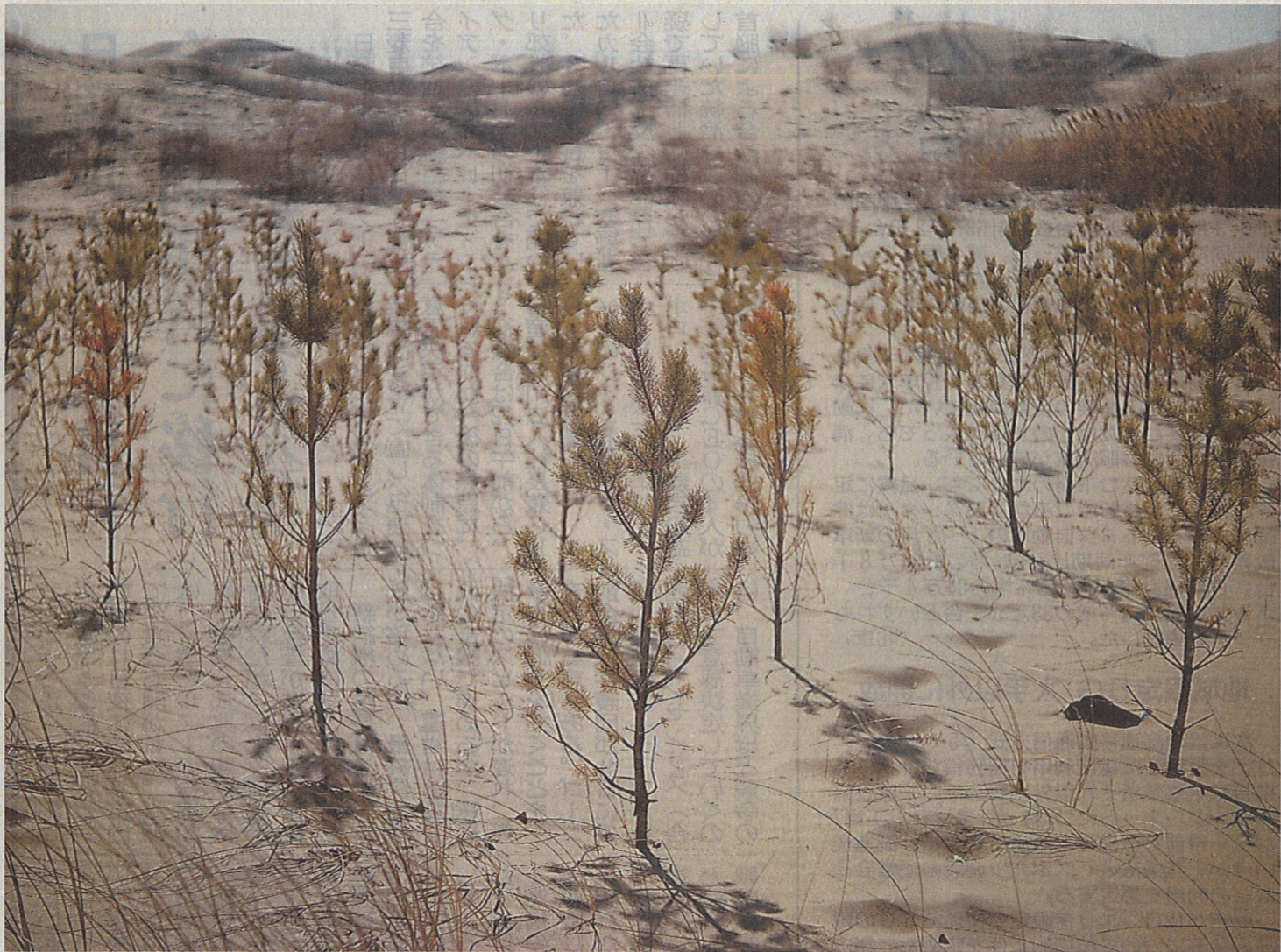
▲砂漠の一角で等間隔に植えられた木